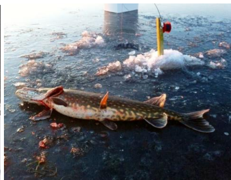
Angelfiske på Halvarsnoren.