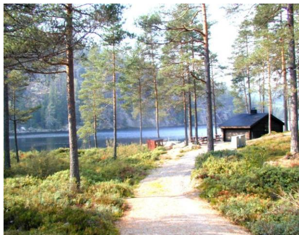
Foto från Bergtjärn

Tillbringa en varm sommarkväll i gott sällskap vid någon av de stora hyrsjöarna Bergtjärn eller Kotjärn.